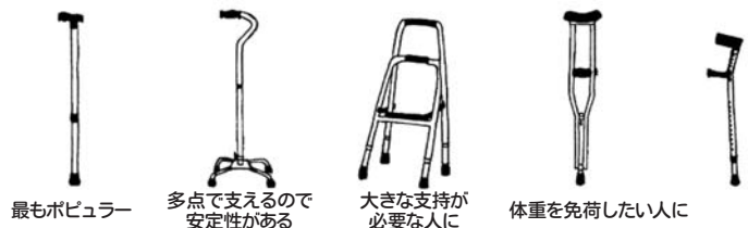
最もポピュラー 多点で支えるので安定性がある 大きな支持が必要な人に 体重を免荷したい人に

ることも出来ます。 ロフトランド杖 前腕を支えるカフと体重を支える持ち手を備えた杖です。前腕の力も使えるのでかなりの体重を支えることが出来、握力のない方や痛みのためにあまり足に体重をかけられない方などにお勧めです。 ウォーキングステッキ (二本杖) ボールと言うステッキを二本使用して歩きます。杖を両手に持つことで背筋が伸び、左右のバランスが取れ姿勢が安定します。両手もしっかりと使うので全身の運動にもなり、リハビリを兼ねて散歩をする方などにお勧めです。